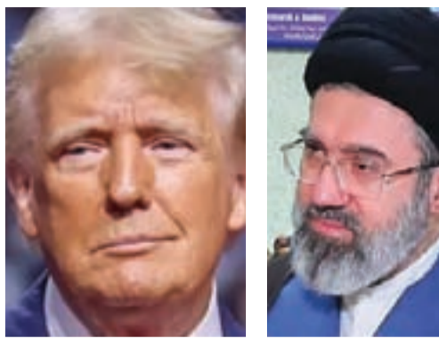
تخلعت عن الحرب الأخيرة فقط وتؤدي إلى الاختلالات انضحت في التقلبات المتأخية التي شهدتها الإقليم خلال الشهرين الماضيين...