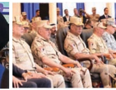
في ظل استمرار التصريحات الوبعية من الرئيس الأمريكي دونالد ترامب، وحسب تقارير إعلامية، فإن تقاسيم للشرق الأوسط...